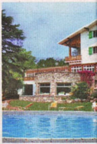
AIRE CORDOBE. Diquecito ofrece pro...