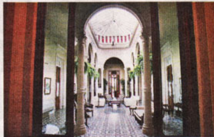
SAN ISIDRO. Cerca de la ciudad, el Hotel del Casco, un palacio con confort.

Situado junto a la Laguna de Melincué, con más de 150 aves diferentes a 110 km de la ciudad de Rosario se encuentra Melincué Casino & Resort. Brinda todo el confort de un 5 estrellas; restaurantes, espectáculos y actividades recreativas. Tres días y dos noches con tour, trekking, bicicleta, personal trainer, masajes con piedras volcánicas calientes, en habitación 5 estrellas con hidromasaje, cuesta